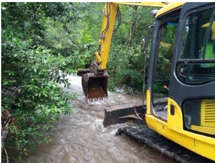
Extracción de los restos del azud el Mazo