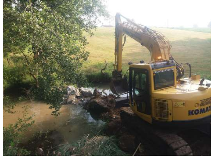
Demolición del azud Hocina