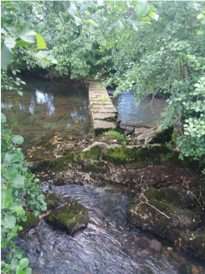
Antes azud Entrambasaguas