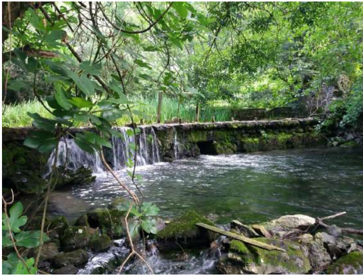
Azud el Mazo