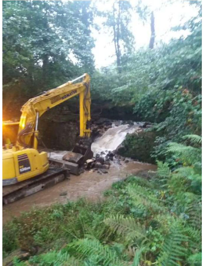
Ejecución de los trabajos: Demolición del azud de Hornedo