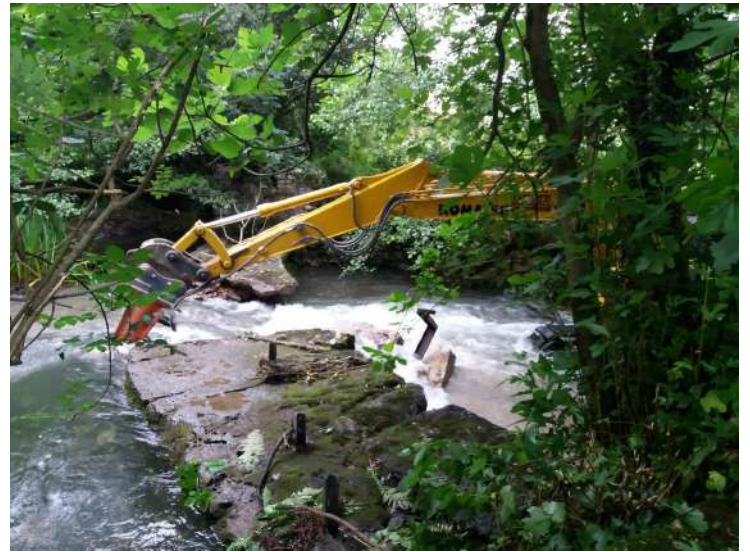
Labores de demolición del azud el Mazo