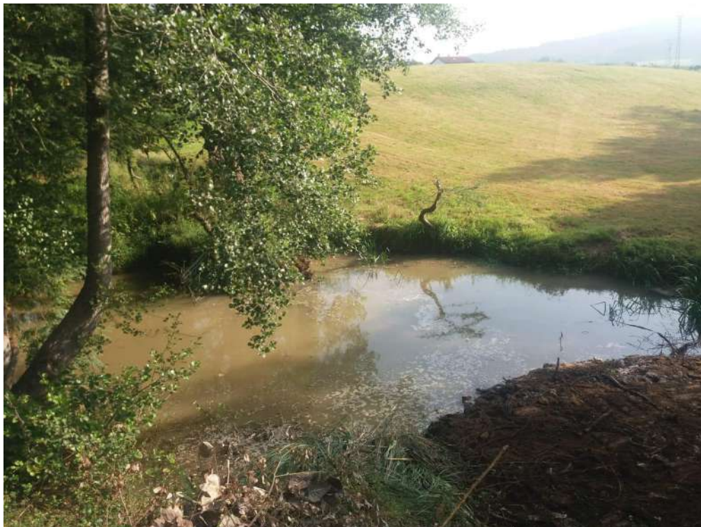
Después de las actuaciones en Hocina